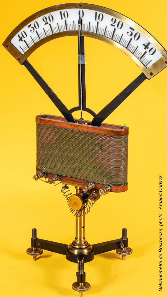
Galvanomètre de Bourbouze